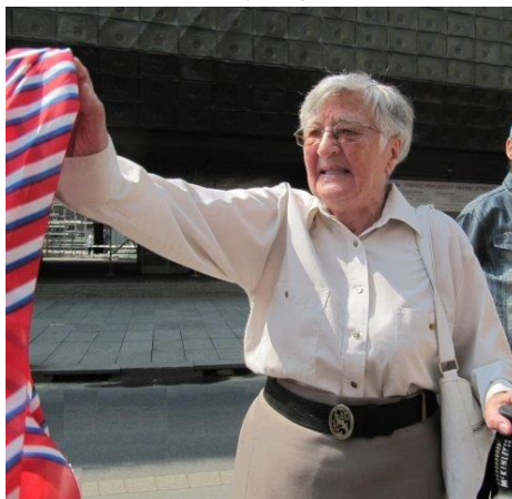
Foto: Dagmar Evaldová zdraví sletový průvod u Národního divadla (2012)