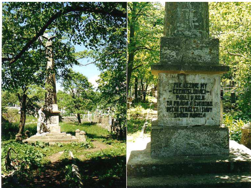
Foto (nahore): Pohřeb Čechoslováků padlých v boji za osvobození města 25. srpna 1918 ve Vladivostoku a (dole) díky péči britského konzulátu dosud zachovaný Československý válečný hřbitov tamtéž. Nebude bez zajímavosti, že v návštěvní knize hřbitova je podpis Ludvíka Svobody s datem z roku 1975.

Čechoslovákům se prostě nasazovat krk za pološlenu admirála nechce. Dostávají se do bojů i s jeho jednotkami. Tím méně za