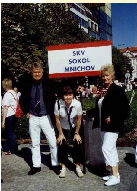
Momentka ze seřadiště

je již tradiční součástí každého všesokolského sletu. V tom letošním se Pražanům opět prezentovaly sokolské župy a jednoty z celého světa.